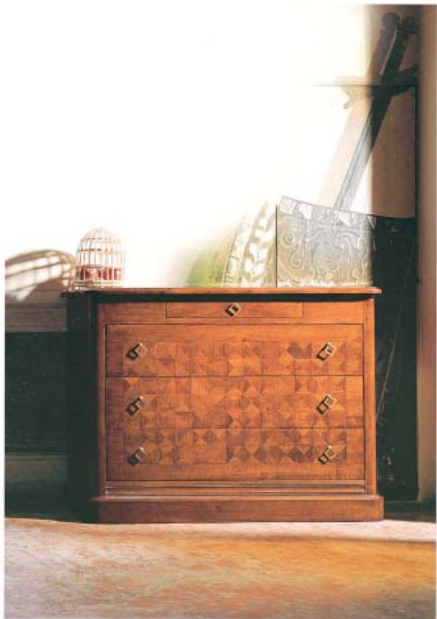
1101 Chest 100x100x80cm