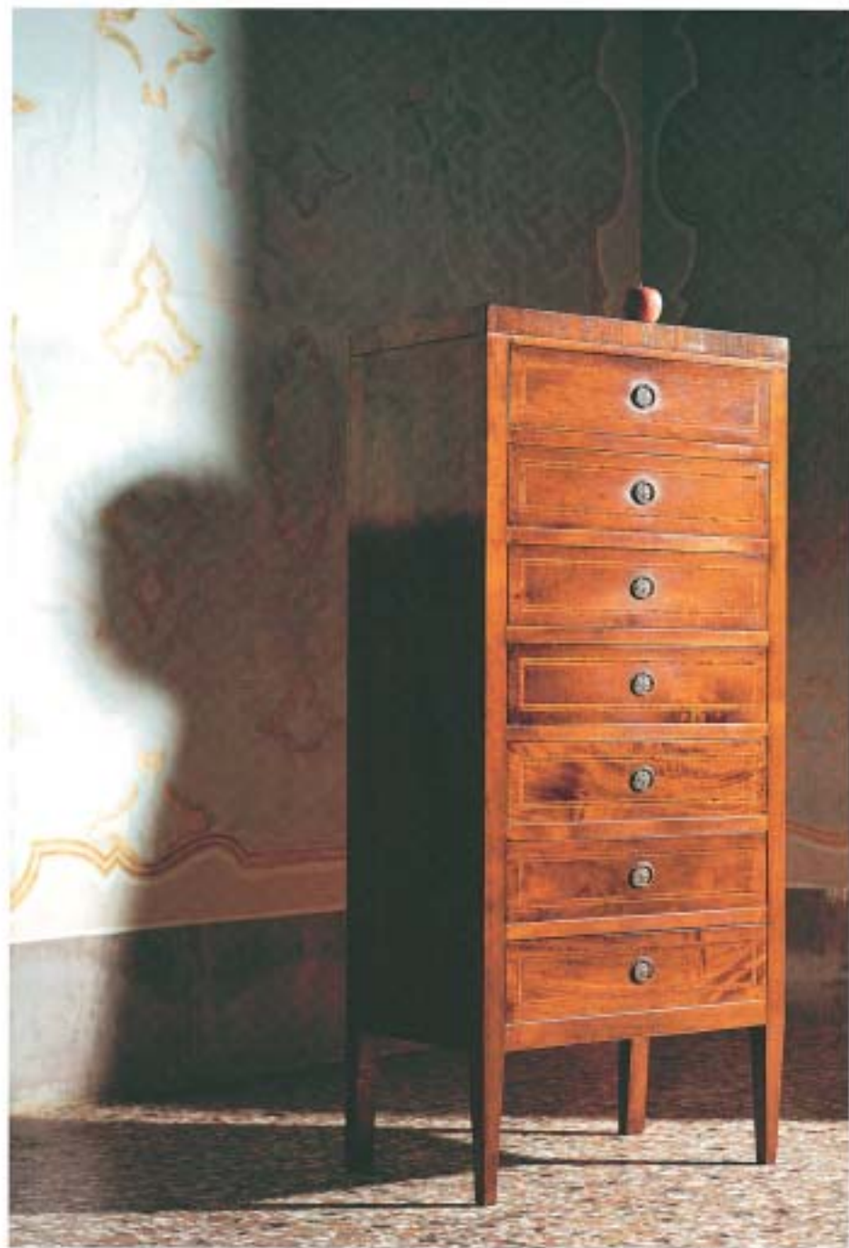
T22 ALCANTARA 1982/1984