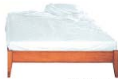
100100 LETTO ALLA FRANCO 180x200x85 cm (LxPxA) 100100