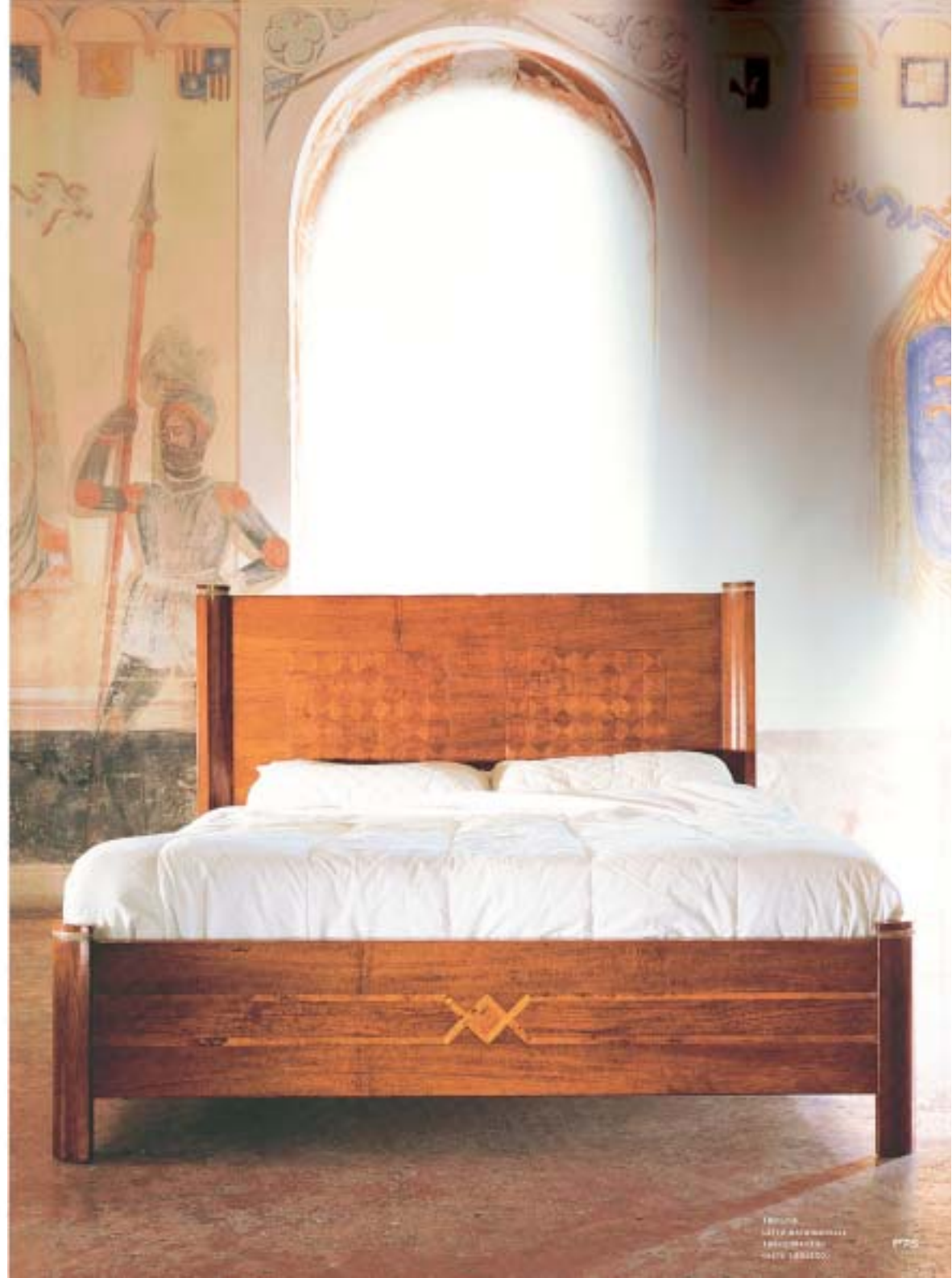
1102 Bed 180x200x80cm