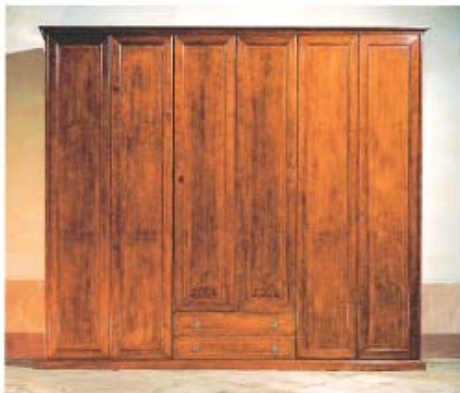
ARMADIO ALMODO & MOLE EST. 1984/1985, 80x