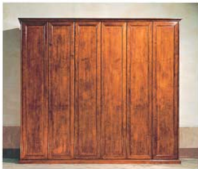
ARMADIO ALMODO & MOLE EST. 1984/1985, 80x