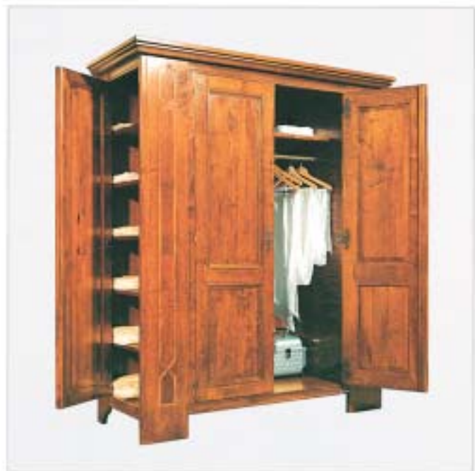
1818 ARMADIO 2 PORTI 178x67x59cm