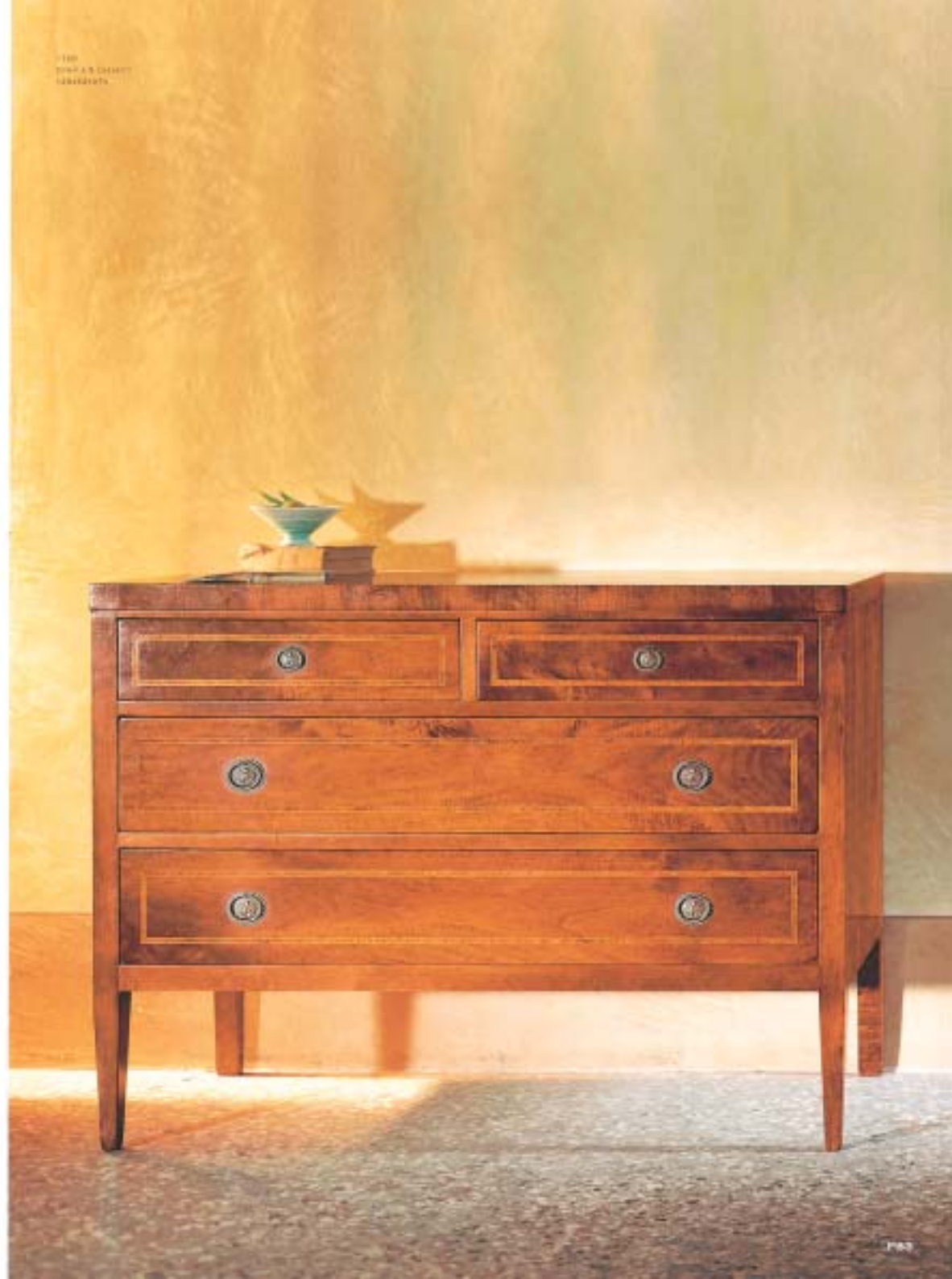
T23 ALCANTARA 1982/1984